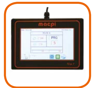
Programmatore Touch screen TCW 7" con USB e Wi-fi totalmente user-friendly grazie ad un display intuitivo e multifunzione. Full color touch screen programmer TCW 7" with USB and Wi-fi, totally user-friendly with a multifunction intuitive display.