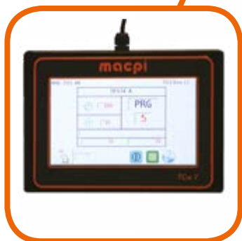
Programmatore touch-screen a colori TCW 7" con porta USB e Wi-fi removibile Full color touch screen programmer TCW 7" with USB and Wi-fi