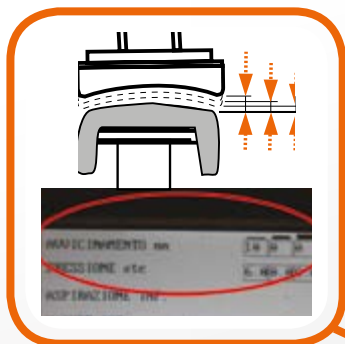
Sfumatura regolabile. Adjustable pressure.