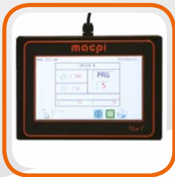
Programmatore touch-screen a colori TCW 7" con porta USB e Wi-fi removibile Full color touch screen programmer TCW 7" with USB and Wi-fi