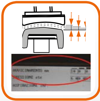
Sfumatura regolabile. Adjustable pressure.