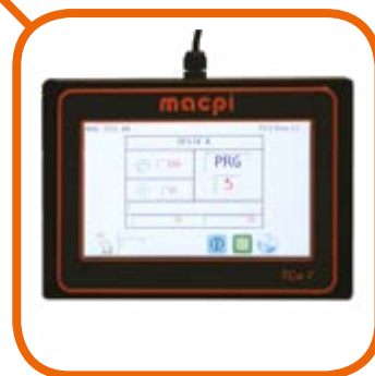
Programmatore touch-screen a colori TCW 7" con porta USB e Wi-fi removibile

Full color touch screen programmer TCW 7" with USB and Wi-fi