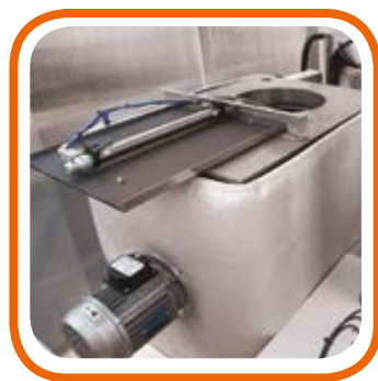
Postazione di raffreddamento ad aria ventilata Ventilated cooling air