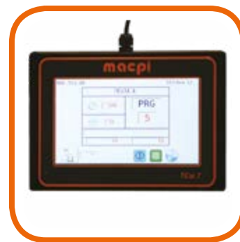
Programmatore Touch screen TCW 7" con USB e Wi-fi totalmente user-friendly grazie ad un display intuitivo e multifunzione.

Full color touch screen programmer TCW 7" with USB and Wi-fi, totally user-friendly with a multifunction in- tuitive display.