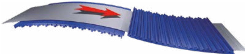
Riscaldamento elettrico All Electric Heating