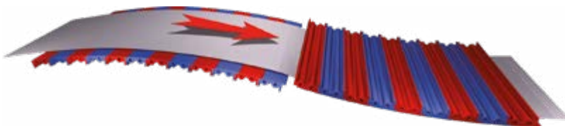
Riscaldamento a vapore ed elettrico Steam & Electric Heating