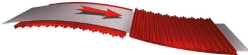
Riscaldamento a vapore All Steam Heating