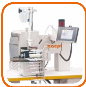
Laminazione nastri Tape lamination