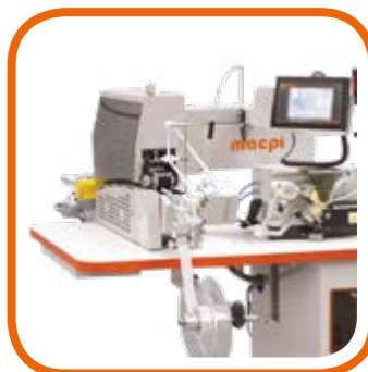
Adesivazione spalline reggiseno Buc strap bonding