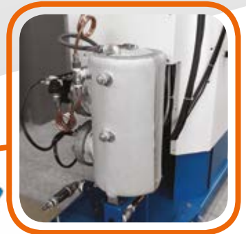
Caldia coibentata da 7 litri con pompa carico automatico inclusa nel tavolo. 7-liter boiler with automatic loading pump included in the table.