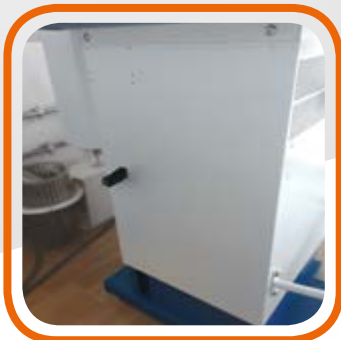
Regolazione altezza piano di stiratura con bilanciatore a gas. Surface ironing height adjustment with gas balancer.