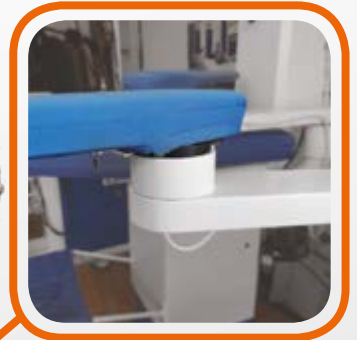
Attacco universale per braccio diam. 85 mm, che garantisce forte aspirazione, con commutazione automatica. Universal attack for arm diam. 85 with automatic switching.