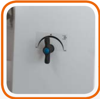
Regolazione quantità di aspirazione e soffiaggio. Blowing suction power regulation.