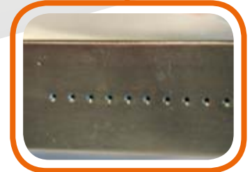
Alto scorrimento. High sliding plate.