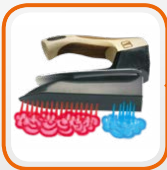
Aria fredda per stabilizzare cucitura: mod.034.11-21-31. Cold air to stabilize the seam: mod.034.11-21-31.