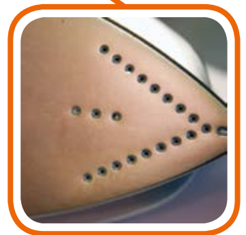
Alto scorrimento. High sliding plate.