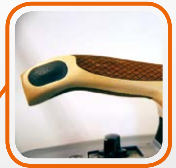
Manico anatomico Wooden and anatomic-shaped handle.