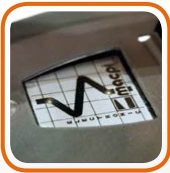
Controllo della temperatura elettronico. Electronic temperature control.