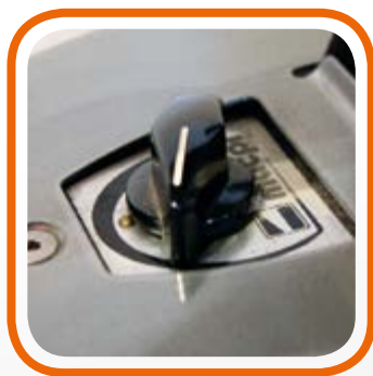
Controllo della temperatura con termostato. Temperature control by thermostat.