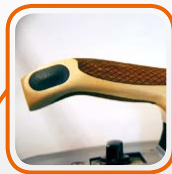
Manico anatomico Wooden and anatomic-shaped handle.